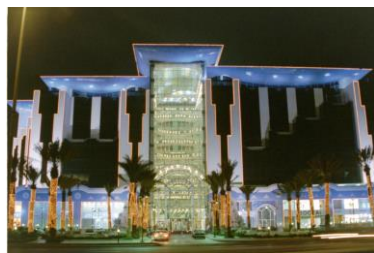
Al-Oasis, Jeddah (AE)