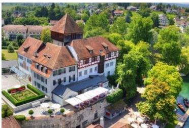
Burg, Diessenhofen (CH)