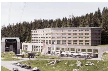
Alpine Resort Säntis, Schwägalp (CH)