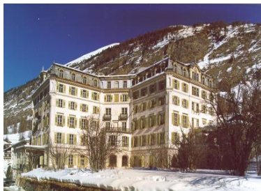
Roseg, Pontresina (CH)