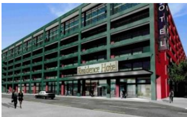
FAG - Areal, Zürich (CH)