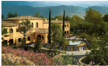
Four Seasons, Tourettes (FR)