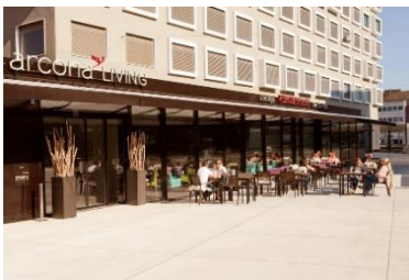
Arcona Living, Schaffhausen (CH)