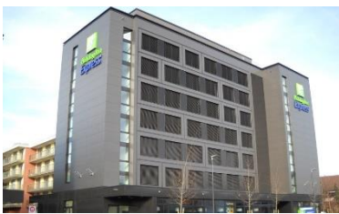
Holiday Inn Express , Affoltern a. A. (CH)