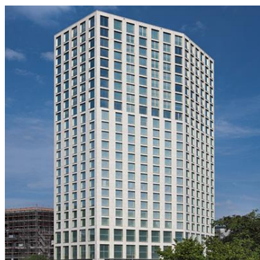
Mobimo Tower, Zürich (CH)