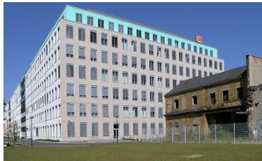
Hauptverwaltung DB, Berlin (DE)