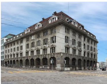
Brandschenke, Zürich (CH)