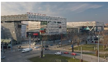
West-Bahnhof, Wien (AU)