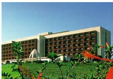
Hilton, Tunis (TN)