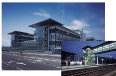
D4 Business Center, Luzern (CH)