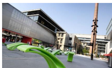
Shilcity, Zürich (CH)