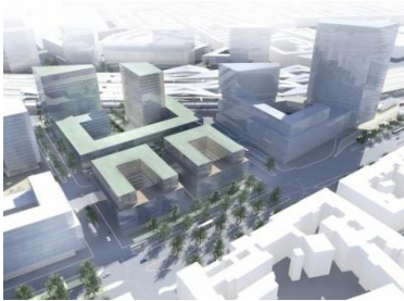
Intercity, Wien (AU)