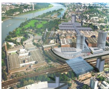
Messe Köln, Köln (DE)