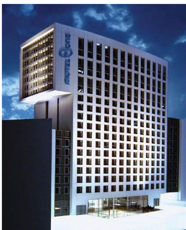
Motel One, Wien (AU)