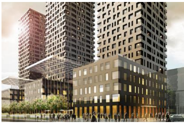
Vulcano, Zürich (CH)