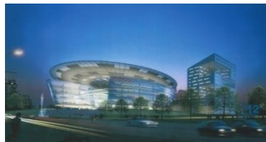
South-East Asia Center, Singapore (SG)