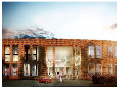
Meilenwerk, Küsnacht (CH)