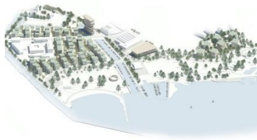
AGGLOlac, Biel (CH)