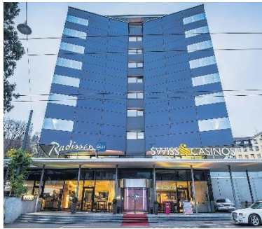
Radisson SAS, Swiss Casino, St. Gallen (CH)