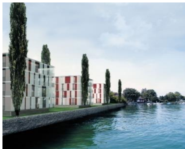
Wohnen Seeufer, Staad (CH)