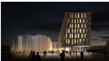
Steigenberger, Bremen (DE)